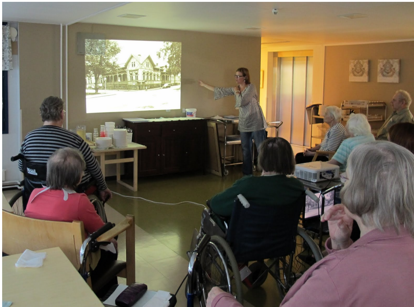
Satakunnan Museon muistelutilaisuus vanhainkodissa.