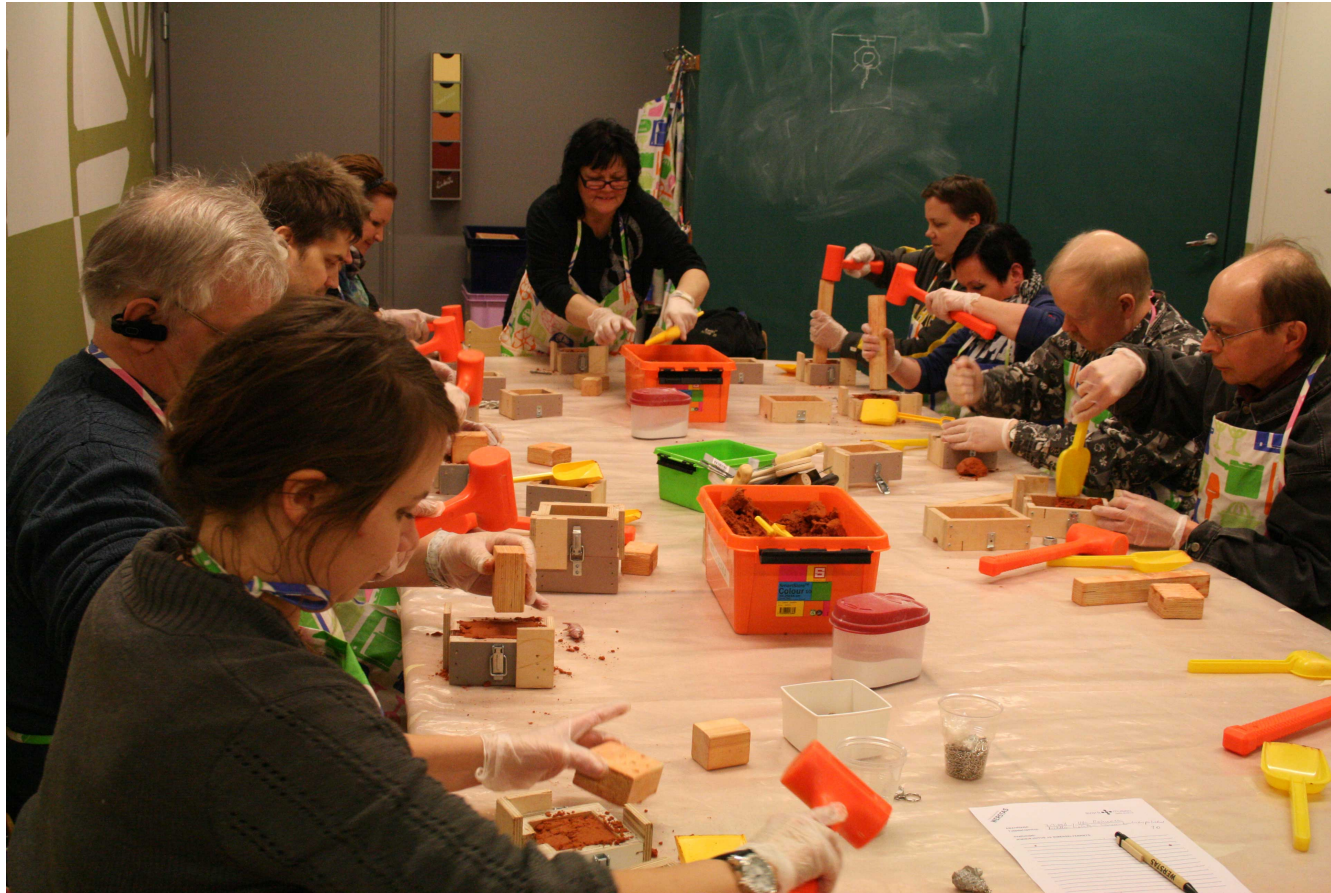
Onnistumisen iloa Metallinhoito -työpajassa.