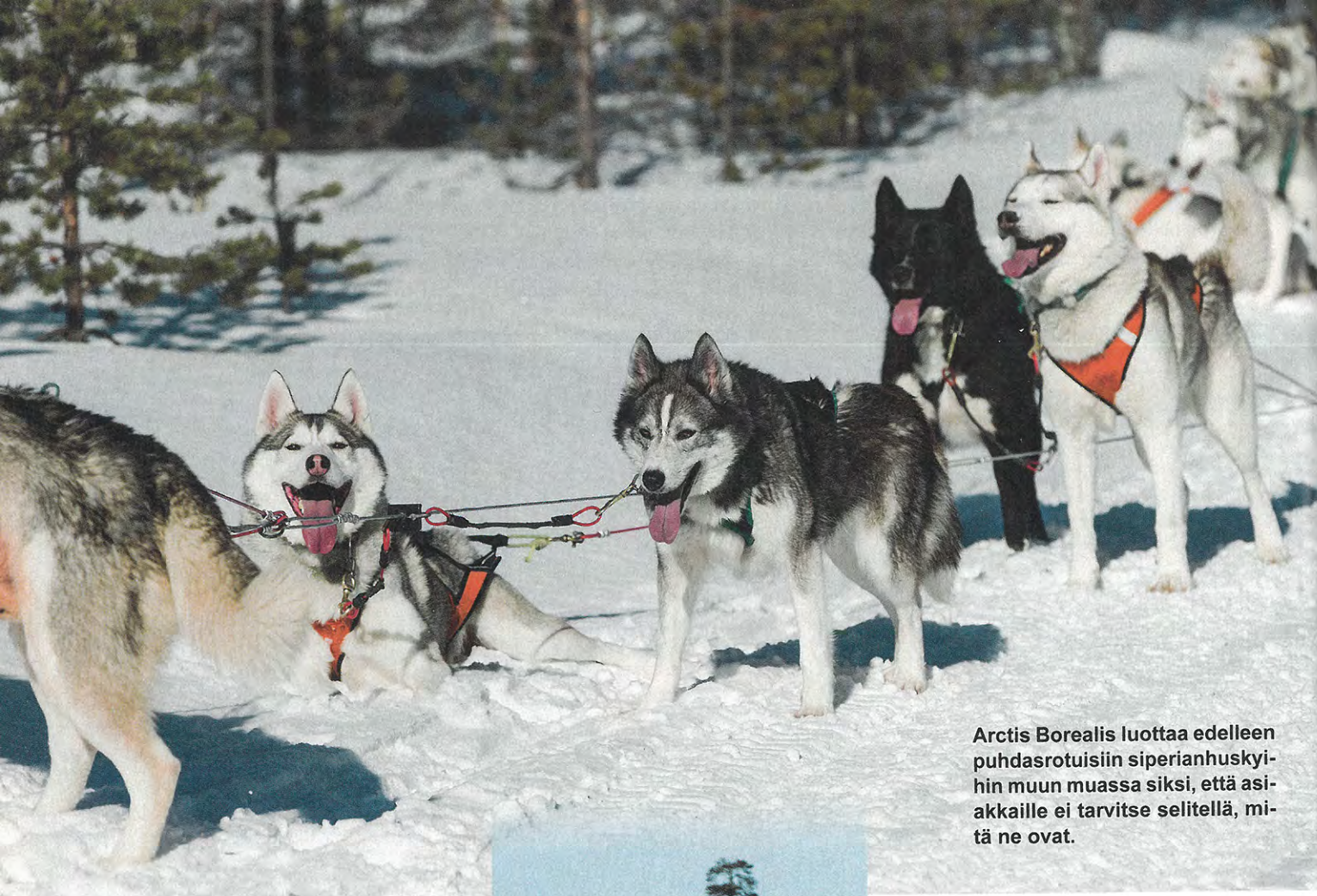
Arctis Borealis luottaa edelleen puhtasrotuisiin siperianhuskyihin muun muassa siksi, että asiakkaille ei tarvitse selitellä, mitä ne ovat.

tain ylimääräistä, jota yritykset voisivat hyödyntää.