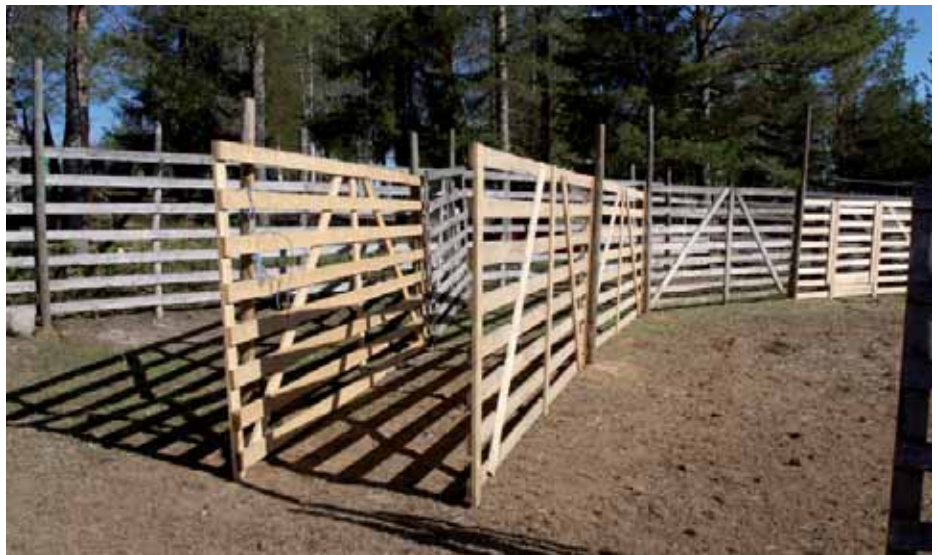
Tukevia kujia pitkin porojen siirtäminen karsinoista toiseen tai esim. kuljetusautoon on helppoa.