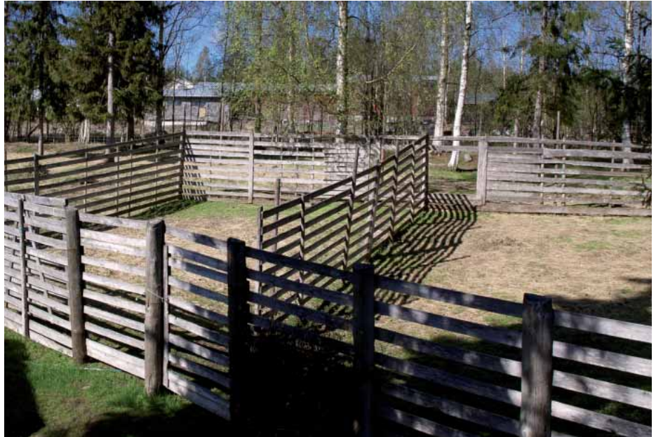
Hyvin suunnitellussa ja rakennetussa tarhassa on totutuskarsina uusille poroille ja karsina erityistä hoitoa tarvitseville sairaille tai muuten heikkokuntoisille poroille.

Tarhassa pitäisi olla vähintään totutuskarsina sinne tuotaville uusille poroille. Totutuskarsinassa porot voidaan totuttaa uusiin rehuihin sekä tarkkailla niitä mahdollisten tautien varalta. Suositeltava ”karanteeniaika” uusille, etenkin kauempaa vieropalkunnista tuoduille poroille on vähintään 2 viikkoa. Totutuskarsina tulisi sijoittaa siten, etteivät uudet porot ole kosketuksissa (aidan läpikään) tarhassa