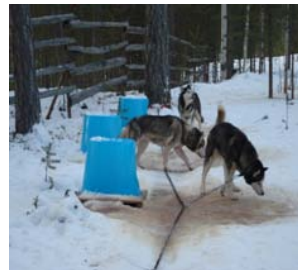
Kuva 4. Vesisaavikoppi ja matkaketju