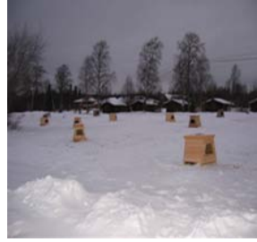
Kuva 16. Matkakoppeja