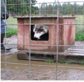
Kuva15. Märkä pohja