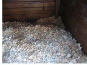
Kuva 10. Kuivikkeita makuualustana