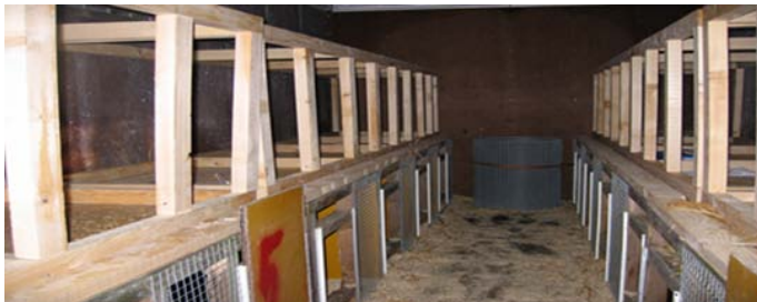
Kuva 19. Rakenteilla oleva kuljetusväline, jossa koirat ovat yöpyneet

Eläinsuojelulainsäädännössä on vain vähän määräyksiä kuljetusvaatimuksista. Tarkastuksessa havaittiin kahdelta kaupallisia eläinkuljetuksia suorittavalta henkilöltä puuttuvan eläinkuljetuslupa ja puutteista annettiin määräykset. Osa tarkastajista ei antanut määräyksiä luvan puuttumisesta vaan he antoivat neuvoja luvan hankkimisesta. Eläinkuljettajalupa tarvitaan, mikäli eläinkuljetus on kaupallista ja eläimiä kuljetetaan yli kuusikymmentä viisi (65) kilometriä. (Laki eläinten kuljetuksesta 16–19 §; eläinkuljetusasetus 1/2005.) Kuljetusvälineitä tutkittiin vain niissä tapauksissa, joissa koirat yöpyivät kuljetusvälineissä. (Lapin lääninhallitus 2009a.)