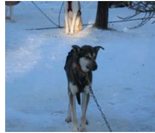
Kuva 2. Alaskanhusky