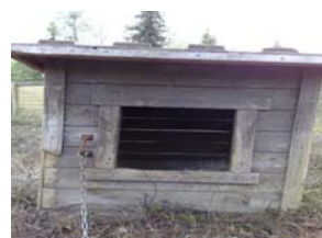
Kuva 8. Hatara koppi