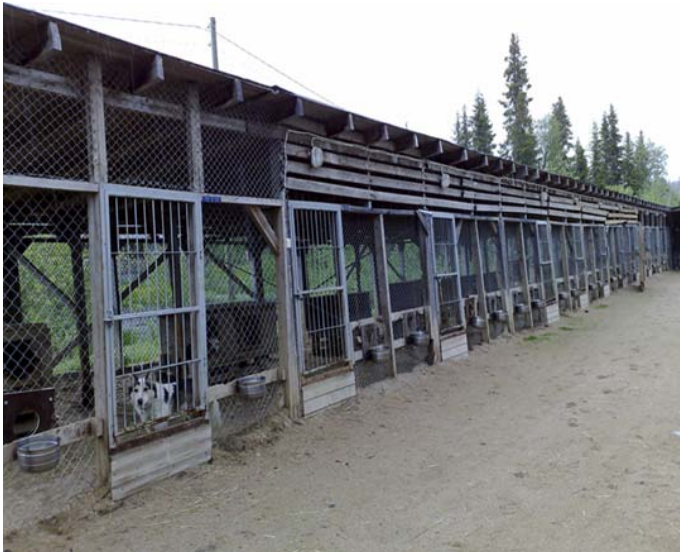
Kuva 17. Koirien häkkiosasto ulkotilassa

Koiran häkkeitä pidetään yleensä kenneleiden ja löytöeläinpaikkojen sisätiloissa. Löytöeläinpaikoissa häkkitilaa saa vähentää tilapäismajoituksessa viidelläkymmenellä prosentilla (ESL 15.1 §). Tarkastuksissa ei ollut mainintaa koirahäkeistä. Lääninhallitukseen lähetetyistä kuvista löytyi kaksi häkkikuvaa (kuvat 17–18) . Häkit ovat poikkeuksellisesti ulkotilassa. (Lapin lääninhallitus 2009a.)