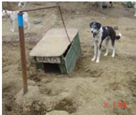
Kuva 11. Romahtanut koppi ja lyhyt ketju

Tarkastuksissa ei tutkittu koirien elinoloja ja kytkentää safariolosuhteissa. Valvontaviranomaisilla on tiedossa, että levähdyspaikoilta puuttuvat usein matkakopit (kuva 16). Koirat ovat matkaketjuissa kytkettyinä ja nukkuvat jopa ilman alusia lumihangessa. Jotkut yrittäjät käyttävät koirilla loimia/takkeja yöpymisen aikana. Safarit kestävät yleensä 1–5 päivää. Levähdys ja yöpymispaikat ovat reitin varrella. (Lapin lääninhallitus 2009a.)