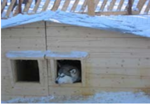
Kuva 9. Uusi kopp