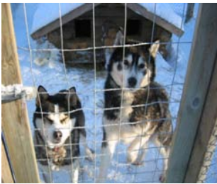
Kuva 1. Siperianhusky

Rekikoirahankkeen raportin mukaan (Lapin lääninhallitus 2009a) yli puolet tarkastuskohteiden rekikoirista on siperianhuskyja (kuva 1). Siperianhusky on rotumääritelmän mukaan käyttötarkoitukseltaan rekikoira ja se on pohjoinen koirarotu, jolla on kaksinkertainen turkki. Se on keskikokoinen, nopeasti ja keveästi liikehtivä käyttökoira. (Suomen Kennelliitto ry 2009.) Lähes puolet tarkastuskohteiden koirista on alaskanhuskyja (kuva 2). Alaskanhuskyä ei voi pitää automaattisesti soveltuvana ulkokasvatukseen. Alaskanhusky ei ole varsinainen koirarotu. Koirat ovat yleisimmin siperianhuskyn ja lintu- tai vinttikoiran risteytyksiä. Yksilölliset erot voivat olla suuria. Koirat ovat turkiltaan ja säänkestävyydeltään hyvinkin poikkeavia toisistaan. (Suomen Valjakkourheilijoiden Liitto ry 2009.)