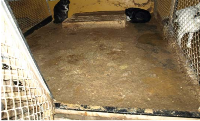
Kuva 18. Ulosteiden likaama häkki