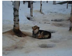
Kuva 14. Ketju kiertynyt lyhyeksi