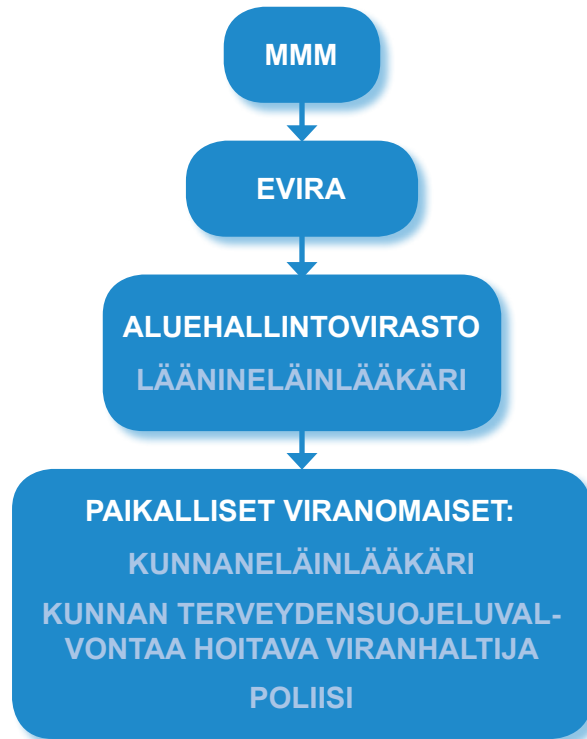
Kuvio 2. Rekikoiriin liittyvät eläinsuojeluviranomaiset

jaan tai tilaan. Marraskuussa 2009 voimaan astuneen uuden eläinlääkintähuoltolain (765/2009) yhtenä tehtävänä on varmistaa eläinsuojeluvalvonnan erottaminen eläinlääkäreiden muista tehtävistä. Tavoitteena on saada kunnat palkkaamaan valtion varoin alueelleen pelkästään valvontatehtäviin keskittyviä virkaeläinlääkäreitä. (Evira 2010e.)