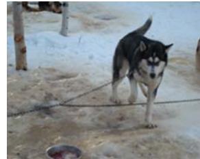
Kuva 12. Matkaketju