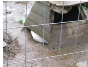
Kuva 6. Koppi maan pinnassa