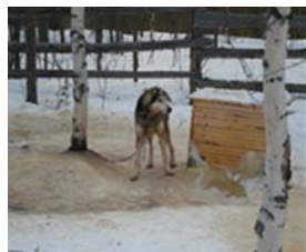
Kuva 13. Ketju puun ympärillä