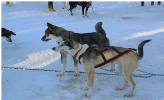
Kuva 20. Rekikoiria valjastettuina

Rekikoirayrittäjiltä toivon parempaa suunnitelmallisuutta tarhoja ja safarireittejä perustettaessa. Maapohjan ja -alueen huolellinen valinta on perusasia. Edellä mainittuihin seikkoihin voisivat myös rahoitus- ja vakuutusyhtiöt kiinnittää huomiotaan. Tarhojen pohjatytöt salaojituksineen, sähköistämisineen ja rakenteineen tulee tehdä suunnitellen ja ajan kanssa. Koirat sijoitetaan mahdollisuuksien mukaan tarhoihin, joissa on asianmukaiset kopit tai säänsuojat ja muu varustus. Ketjupaikoista luovutaan mahdollisuuksien mukaan. Niille koirille, joita on parempi pitää ketjussa, on kytkennän ja tilavaatimuksen oltava eläinsuojelusäädösten mukaiset. Eläinten terveyteen ja hyvinvointiin kiinnitetään entistä parempaa huomiota ja seuranta tehostetaan esimerkiksi kirjanpidon avulla. Koirille annetaan enemmän virikkeitä varsinkin työajan ulkopuolella ja liikunnantarpeen tyydyttämisestä huolehditaan. Yrittäjien tulee tuntea paremmin eläinsuojelulainsäädäntöä ja huolehtia ilmoitusvelvollisuudestaan sekä mahdollisten lupien hankinnasta. Hyvinvoiva eläin tuottaa paremmin. (Lapin lääninhallitus 2009a.)