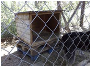
Kuva 5. Suuri kulkuaukko