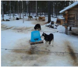
Kuva 3. Vesisaavikoppi

Rekikoirayrittäjien pitopaikoista löytyi myös ala-arvoisia koppeja/säänsuojia. (Kuvat 3–8,11). Rekikoirayrittäjien mielikuvituksella ei liene rajoja, kun muovinen vesisaavi on pantu täyttämään säänsuojan tehtävää. Kuvat kertonevat enemmän kuin tuhat sanaa.