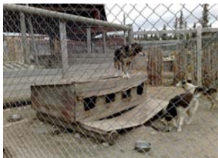
Kuva 7. Rikkinäinen koppi