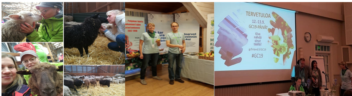
Kuvia vierailusta Mo i Ranaan. Hanketorilla tavattiin monia Green Care -päivien osallistujia.

Hanke järjesti 7.-10.10. tutustumismatkan ja työpajan Mo i Ranaan Norjaan. Matkan aikana verkostoiduttiin alueiden ja maiden välillä sekä saatiin paljon arvokasta tietoa erityisesti Norjan Inn på Tunet -toiminnasta sekä työpajan alustusten että tilavierailujen kautta. Eri maiden toimintamallien vertailusta ja kokemusten vaihdosta saatiin kotiin viemiseksi monia uusia ideoita ja työvälineitä oman luontoperustaisen toiminnan kehittämiseen. Työpajasta enemmän matkaraportista.