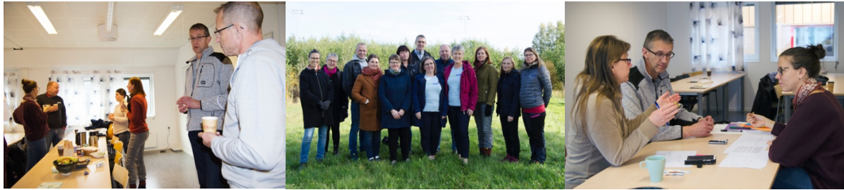
Kahvitauko, tehtävä ulkona ja keskustelua palvelumuotoilun työpajassa Luulajassa.

Tiivistelmät työpajoista ja opintokäynneistä (suomeksi)